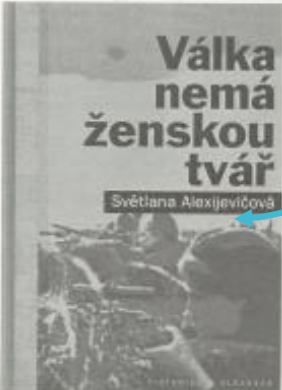
autorčím otázku, kdy se poprvé v dějinách objevily ve válce ženy, se samozřejmě

Když p... rodiny, bojí 2... právěn každý... znává, literou vímim, i repro dostí, k roznejš manžel válku a čeni, je „fronta žasto i Muzey válce o příklad střelou někoho vzpomi svou že ženskou očími b ženu jak sté hrát paní Sv ženska' iskv an všim